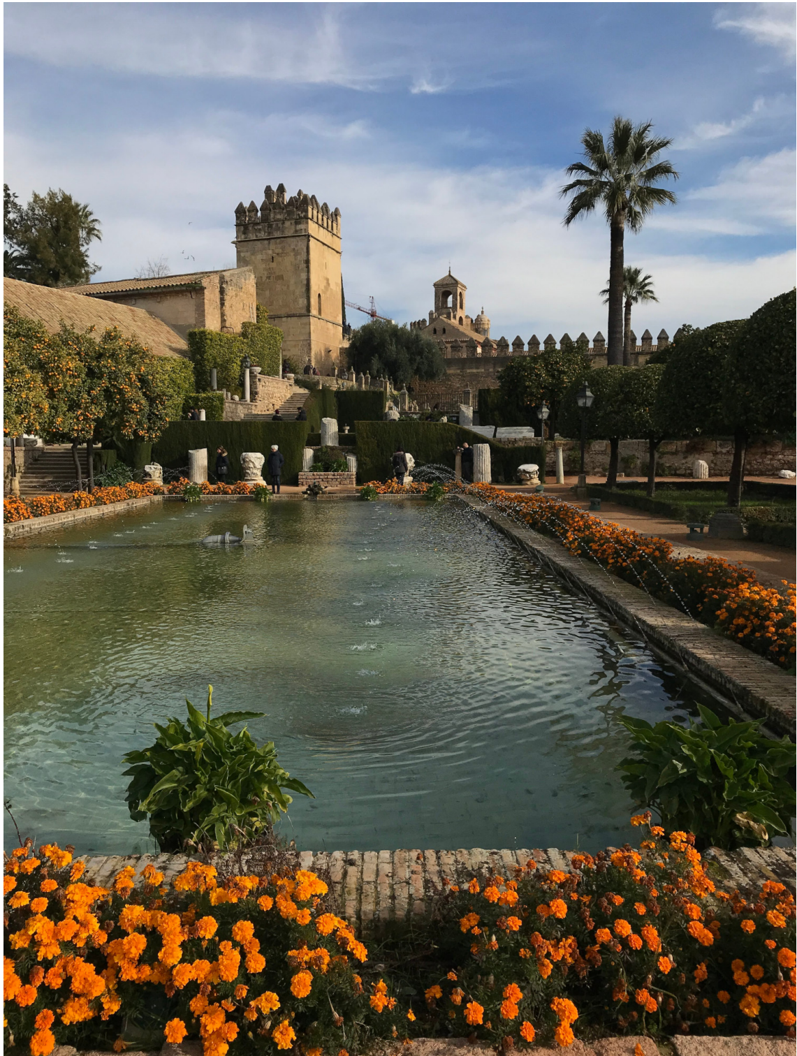
Figure A.1 – Alcázar de los reyes cristianos, Córdoba. Ahura klik.