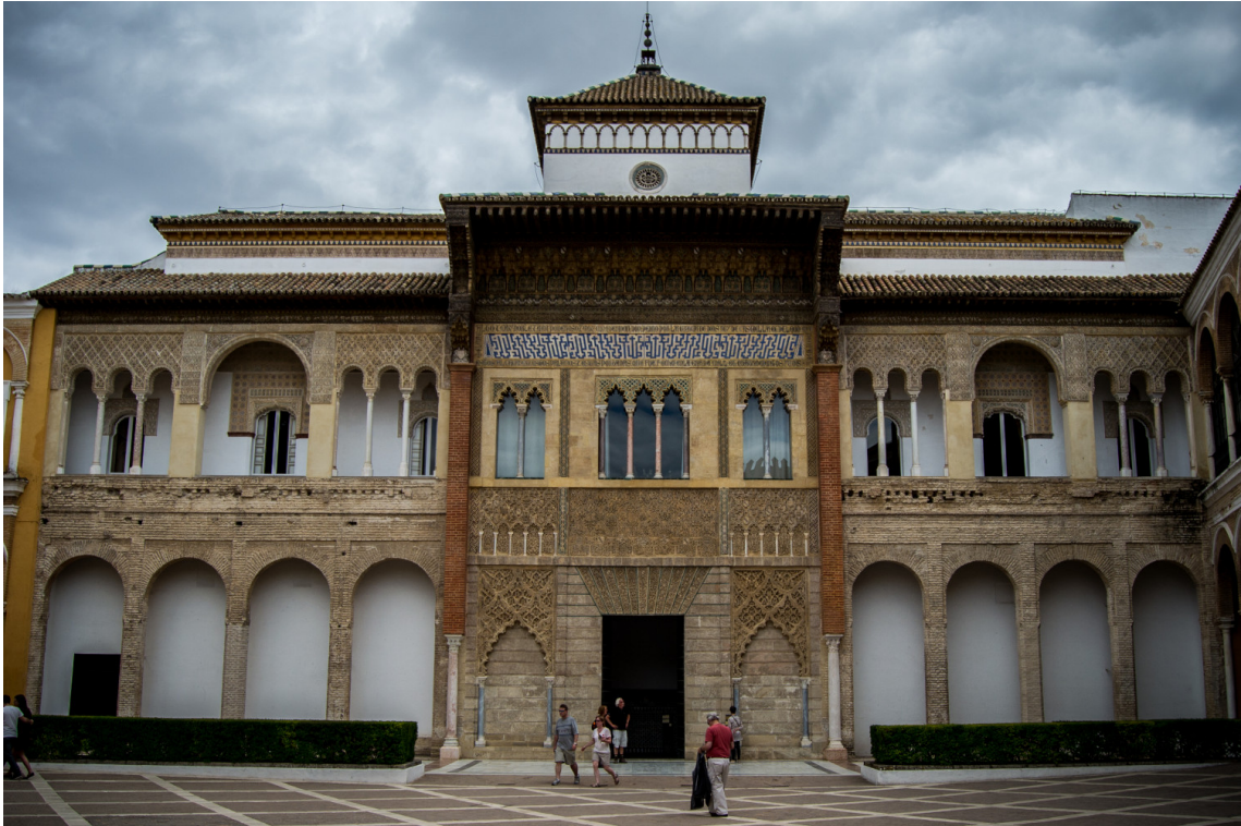
Figure 1.1 – Fachada del Palacio del rey don Pedro, en el Real Alcázar de Sevilla. Alberto Bravo .

Nulla non mauris vitae wisi posuere convallis. Sed eu nulla nec eros scelerisque pharetra. Nullam varius. Etiam dignissim elementum metus. Vestibulum faucibus, metus sit amet mattis rhoncus, sapien dui laoreet odio, nec ultricies nibh augue a enim. Fusce in ligula. Quisque at magna et nulla commodo consequat. Proin accumsan imperdiet sem. Nunc porta. Donec feugiat mi at justo. Phasellus facilisis ipsum quis ante. In ac elit eget ipsum pharetra faucibus. Maecenas viverra nulla in massa.