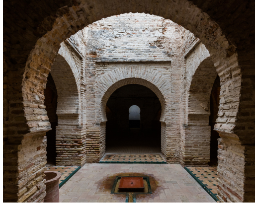
(b) Mezquita, Alcázar, Jerez de la Frontera, España Diego Delso .