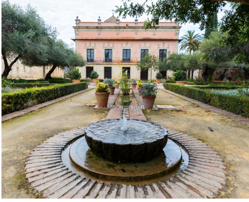
(a) Palacio de Villaviciencio, Alcázar, Jerez de la Frontera. Diego Delso .